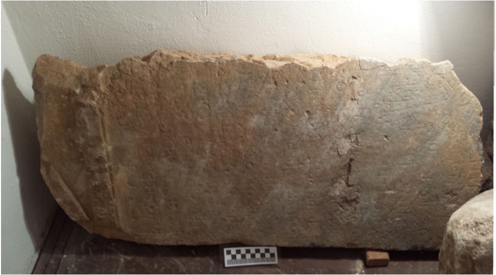
Figura 2 Museo Epigrafico (EM 13148).