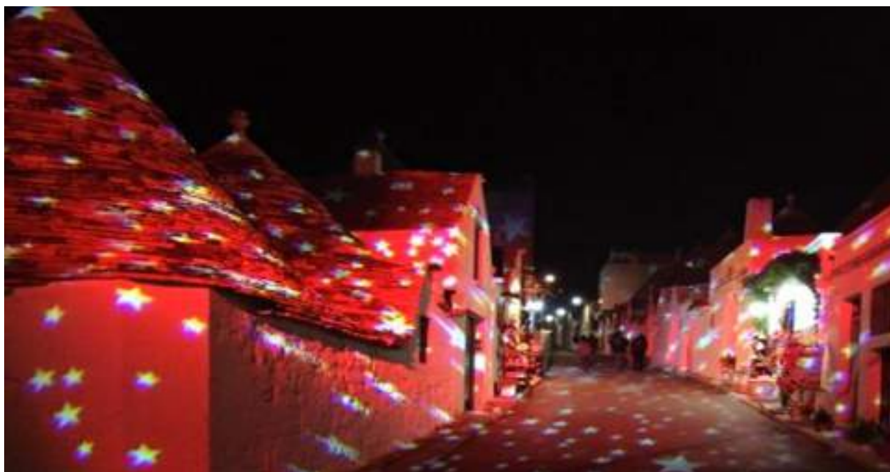
FIGURA 4 – Il Festival delle Luci di Alberobello