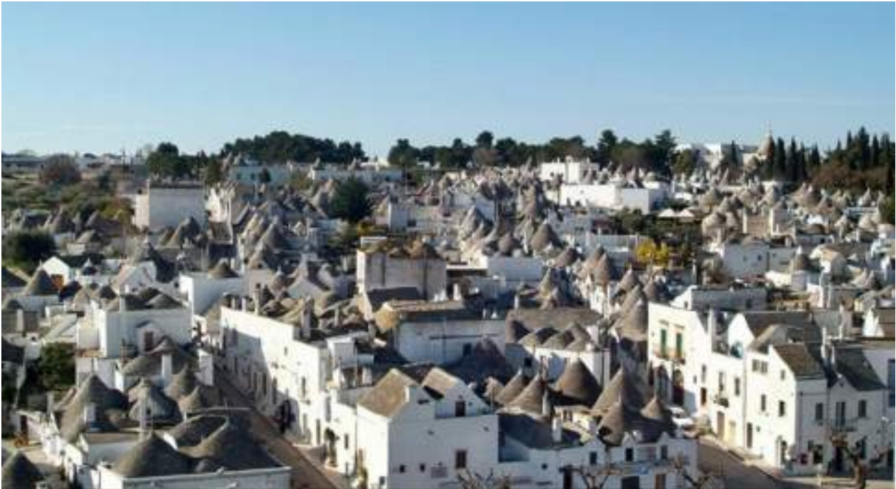
FIGURA 3 – Il rione Monti ad Alberobello