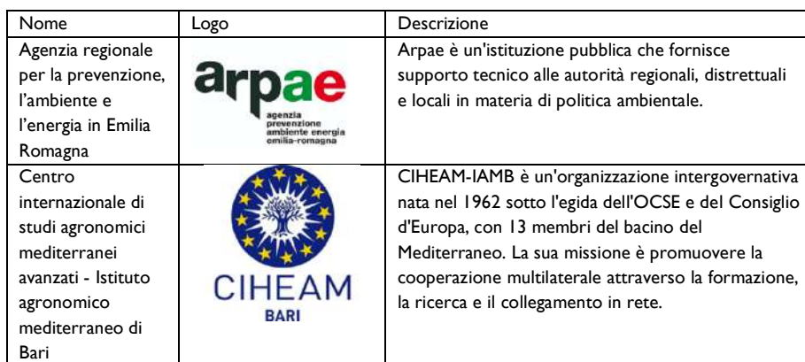
Tabella 1 – Project partner

di azioni specifiche attraverso un'efficace cooperazione transfrontaliera. I risultati finali porteranno probabilmente diversi vantaggi agli abitanti, come “pianificazione di misure ambientali innovative, miglioramento della gestione e delle politiche ambientali regionali, introduzione di un uso più ecologico della terra, riduzione dei rischi dei cambiamenti climatici, godimento di nuovi prodotti qualificati per l'ambiente” (Sito GECO2). Per quanto riguarda lo scopo specifico di creare e testare, su scala regionale, un mercato volontario del credito al carbonio progettato per compensare le emissioni di CO 2 e, il progetto coinvolgerà direttamente il settore agricolo, “esortandolo ad adottare modelli di produzione” sostenibili “e rispettosi dell'ambiente” (Documento ufficiale GECO2). La durabilità dei risultati sarà garantita dagli impegni a lungo termine firmati dagli agricoltori e dalle imprese (almeno 5 anni) nell'ambito del progetto pilota. Anche la creazione di un mercato sperimentale del carbonio durerà almeno 4 anni dopo la fine del progetto, perché possa diventare economicamente sostenibile. Per quanto riguarda il contenuto del presente contributo, è fondamentale notare come il progetto sia innovativo, con particolare riferimento alla mancanza di esperienze strutturate reali in questo campo. Il progetto, di conseguenza, sarà probabilmente preso come modello per ulteriori progetti di sviluppo.