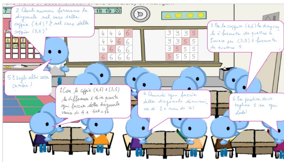
Figura 4. Scenetta aggiuntiva realizzata a seguito della discussione. 5

Al termine della discussione gli insegnanti hanno prodotto delle nuove scenette, dimostrando di aver fatto proprie le osservazioni emerse durante la discussione. In Figura 4, ad esempio, è riportata una di tali scenette, da intendersi come successiva a quella in Figura 3. In questo nuovo pezzo di scenario i partecipanti hanno scelto di mostrare come l’insegnante possa ipotizzare di intervenire per fare in modo