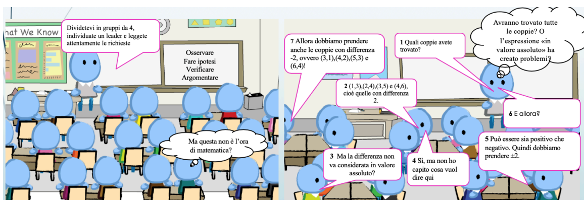
Figura 1. Due esempi di scenette che compongono uno scenario. 2

Uno scenario rappresenta un insieme di scenette che fotografano i momenti salienti di una determinata attività didattica svolta in classe, in cui si rendono espliciti gli interventi dell'insegnante e degli studenti.