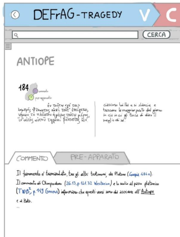
Fig. 2: prototipo su carta del commento al fr. 184 Kn.

d'ordine che identifica le tre tipologie testuali: un commento contenente l'interpretazione complessiva, con particolare riferimento, per quel che attiene ai frammenti, all'individuazione della persona loquens e della parte strutturale della tragedia alla quale questi siano da ricondurre e, in caso di tradizione indiretta, all'analisi del contesto di citazione. Al numero d'ordine dei frammenti appartenenti a quest'ultima fattispecie è agganciato anche un pre-apparato, che registra l'apporto delle fonti di tradizione indiretta e consente di raggiungere la traduzione e/o le edizioni di riferimento di queste ultime (fig. 2).