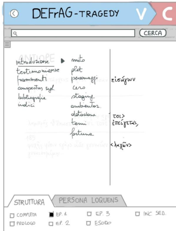
Fig. 1: prototipo su carta del menu principale di DEFrAG-Tragedy

ze mitiche, dei passi paralleli, dei modelli o echi letterari, delle fonti scoliastiche o lessicografiche; ai database per la catalogazione, la descrizione e la riproduzione dei manufatti di trasmissione (papiri e manoscritti medievali) e delle fonti iconografiche; agli archivi elettronici per le edizioni e gli studi moderni; e, ancora, ai lessici online e agli atlanti digitali per il mondo greco e romano. Radunando e integrando in un collettore unico le principali risorse informatiche per gli studi classici, la piattaforma ovvia, peraltro, alla dispersività propria delle ricerche in rete.