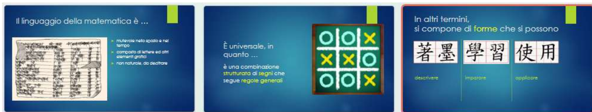
Fig. 4. Un concetto espresso con l'ausilio di figure e con diversi spunti interdisciplinari