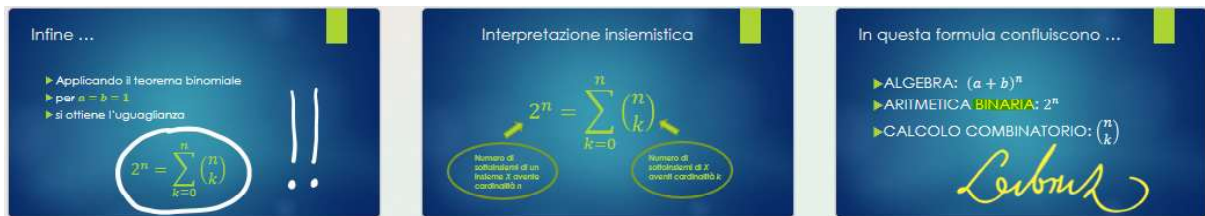
Fig. 3. Il mondo che ruota intorno ad una formula: diapositive di sintesi

Tale rappresentazione ha il vantaggio di familiarizzare lo studente con