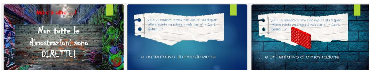
Fig. 6. Un tentativo di dimostrazione diretta fallisce: attenzione!