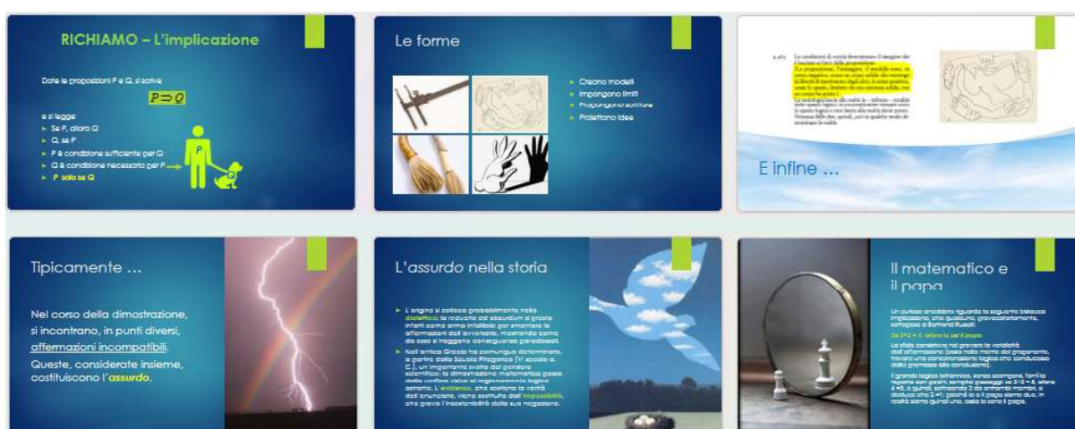
Fig. 2/in alto. Tre esempi di interazione tra testo ed immagini Fig. 2/in basso. Il principio della dimostrazione per assurdo, variamente illustrato

Il soggetto che ha redatto il testo è dunque, in un certo senso, diverso dal soggetto che lo commenta: a frangere sono, nella stessa persona, un pensiero compiuto e un pensiero in evoluzione , corrispondenti a due distinte fasi della riflessione matematica. Quanto al primo, l’opera, presente fin dall’inizio nella sua forma definitiva, non è in grado di rivelare il processo che ha portato alla sua costruzione: è una scatola chiusa, dentro la quale ciascuno dei fruitori può scavare a suo piacimento, scegliendo un proprio percorso di esplorazione. Ciò è tanto più vero quanto più la singola diapositiva, da un lato, è laconica, dall’altro è una (scarna) composizione di elementi fondamentali e potenzialmente carichi di significato. Tutti devono comunque risultare idonei ad essere osservati, sezionati in parti o interrogati nel loro complesso, e l’abbinamento ideale si verifica forse tra elementi che si prestano ad una trattazione analitica (esposizione didattica, dettagliata e rigorosa), ed altri che, invece, devono essere decifrati (raffigurazione priva di didascalia). I primi potranno essere utilizzati come chiave d’accesso ai secondi, e si finirà, magari, per scoprire come, viceversa, i secondi illustrino i primi evidenziandone proprietà altrimenti sfuggenti. Queste non sono necessariamente di natura tecnica, potendo anche consistere in un insospettato valore estetico, oppure in un sorprendente risvolto filosofico.