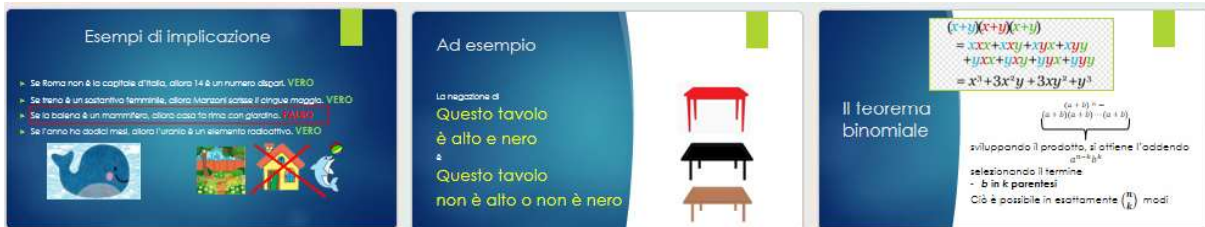
Fig. 5. Le immagini concretizzano un pensiero, ma il legame con il testo è da trovare